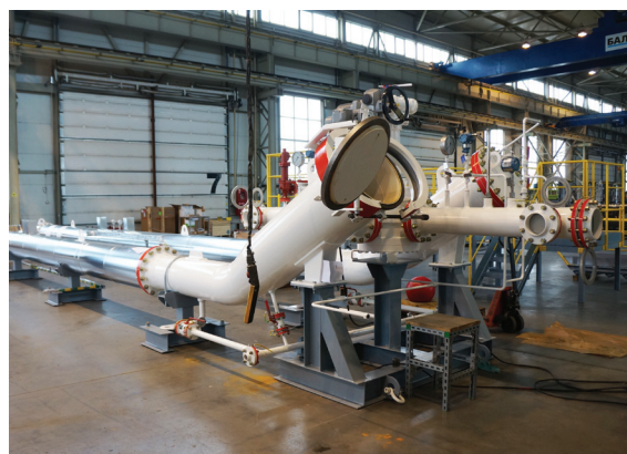
ТПУ (U-образная), ANSI 150, АО «Транснефть - Приволга»