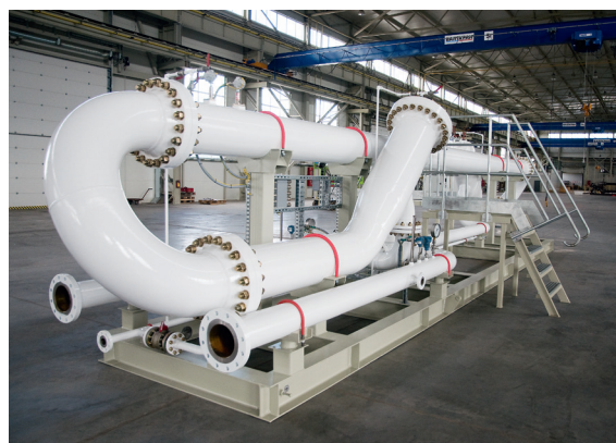
ТПУ с прямым участком, производительность 600 м 3 /ч ANSI 300, Филиал «Газпромнефть-Муравленко»

Получение достоверной информации о количестве углеводородных жидкостей, разработка и внедрение новых измерительных технологий обусловлено потребностью предприятий ТЭК в оптимизации финансовых затрат и сокращении времени на техническое обслуживание, эксплуатацию, поверку преобразователей объемного и массового расходов, ТПУ в составе измерительных систем СИКН/СИКНП, снижении финансовых рисков во время транспортировки углеводородных жидкостей по трубопроводам между нефтегазодобывающими предприятиями и экспортных операциях.