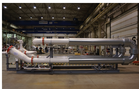
ТПУ «Скорпион» ANSI 1500, ПАО «Татнефть»